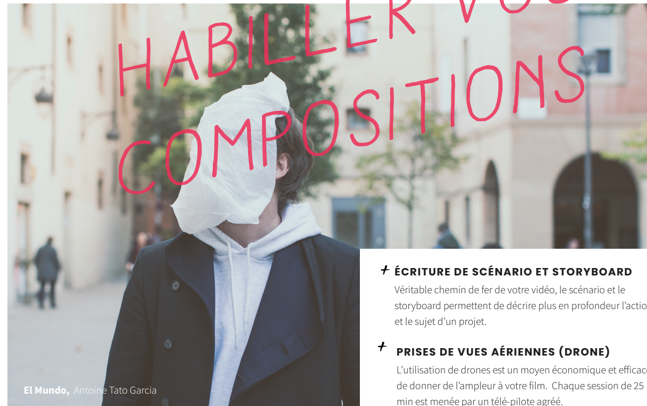
El Mundo, Antoine Tato Garcia