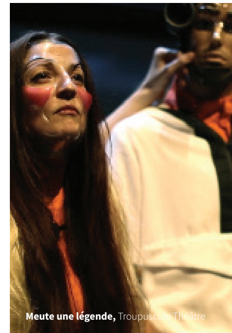
Meute une légende, Troupuscule Théâtre