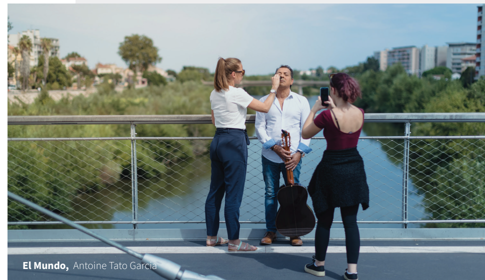
El Mundo, Antoine Tato Garcia

Recherche et analyse du thème, organisation de la structure narrative et choix du dispositif de la mise en scène documentaire.