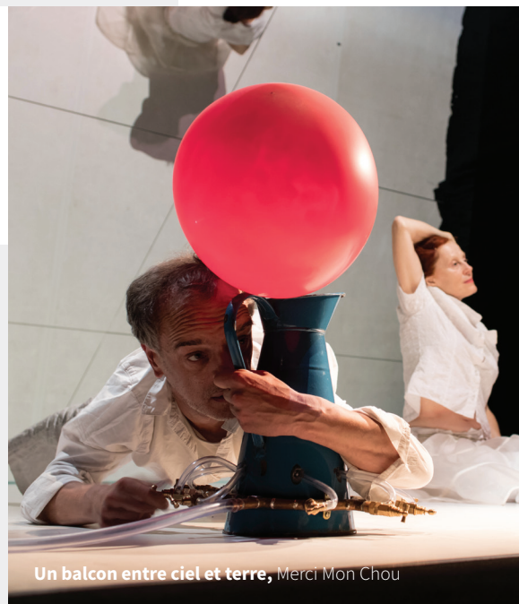
Un balcon entre ciel et terre, Merci Mon Chou